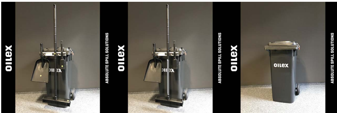
OILEX Spill Kit AS